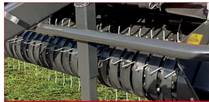
Модель RB 120 поставляется с устройством измельчения.