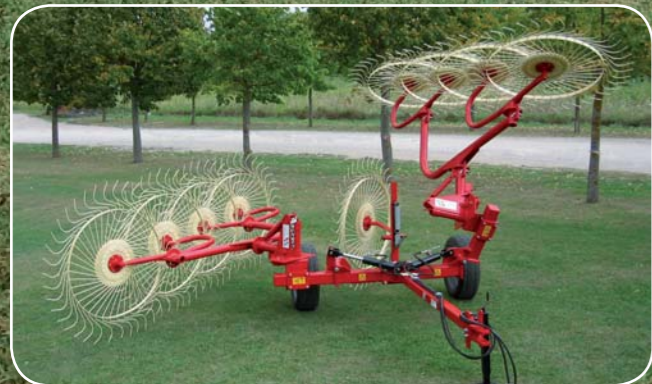
Опция: комплект шарового клапана для работы одной стороной